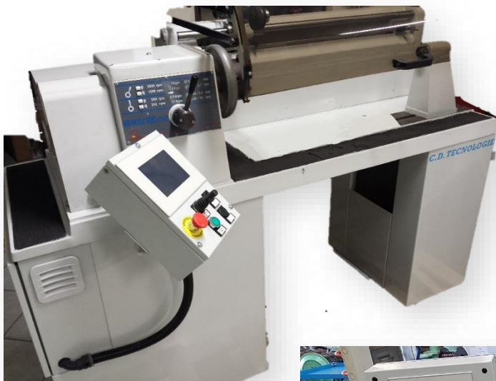
BOBIFIL ER 900