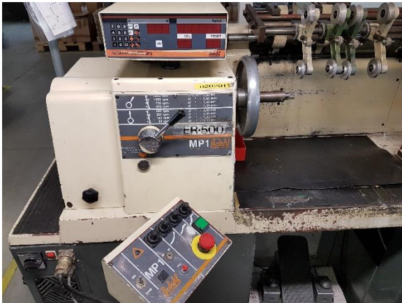
BOBIFIL ER 500